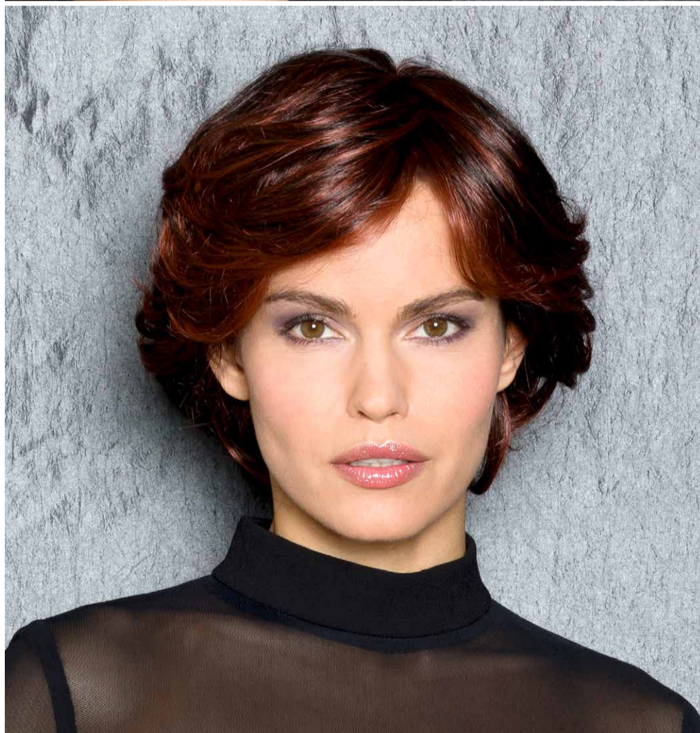
THE BEAUTY Dark-Cherry