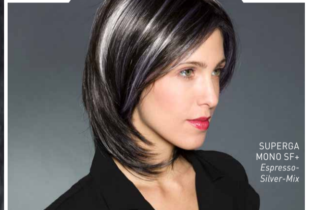
SUPERGA MONO SF+ Espresso-Silver-Mix